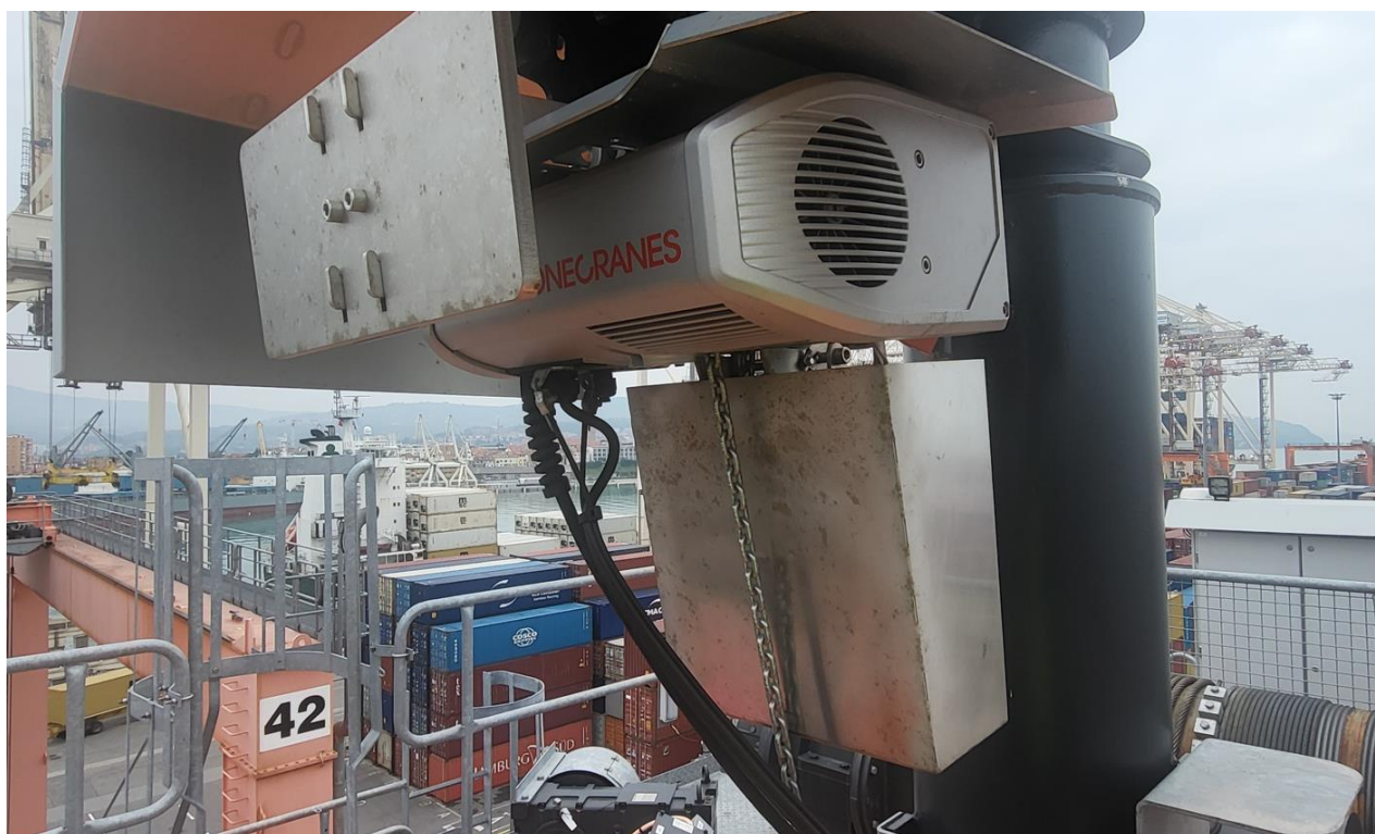
Slika 4: Obstoječe servisno dvigalo na RTG dvigalu