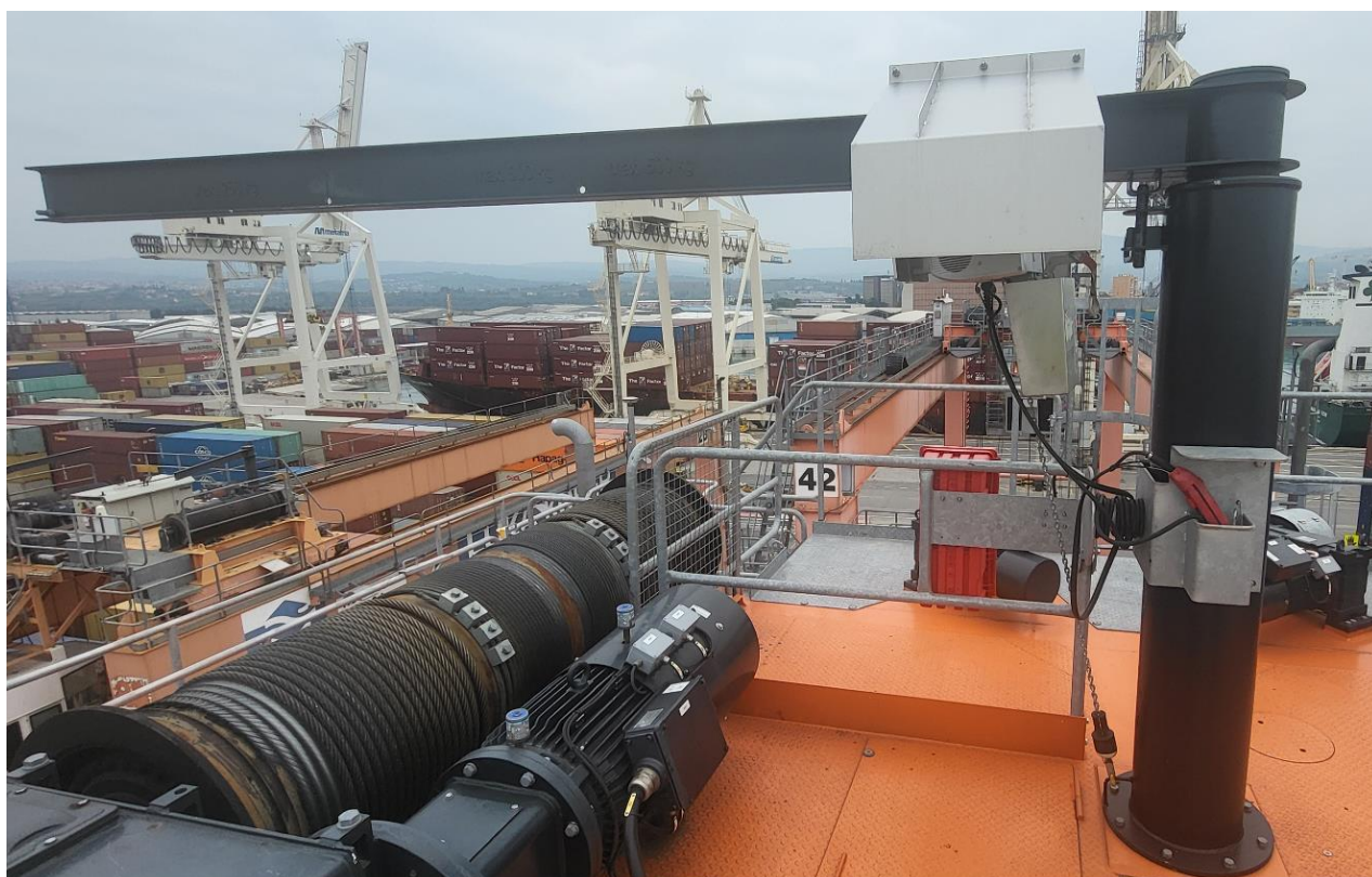
Slika 3: Obstoječe servisno dvigalo na RTG dvigalu

Trenutno imajo na kontejnerskem terminalu na obstoječih RTG dvigalih že vgrajena servisna dvigala. Želja terminala je, da bi tudi na RMG dvigala izvedli enak sistem servisnih dvigal kot jih imajo že vgrajena na RTG dvigalih (glej sliko 3 in sliko 4).