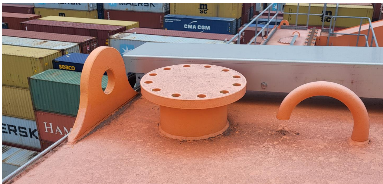
Slika 2: Lokacija namestitve servisne konzole z dvigalom

Trenutno imajo na kontejnerskem terminalu na obstoječih RTG dvigalih že vgrajena servisna dvigala. Želja terminala je, da bi tudi na RMG dvigala izvedli enak sistem servisnih dvigal kot jih imajo že vgrajena na RTG dvigalih (glej sliko 3 in sliko 4).